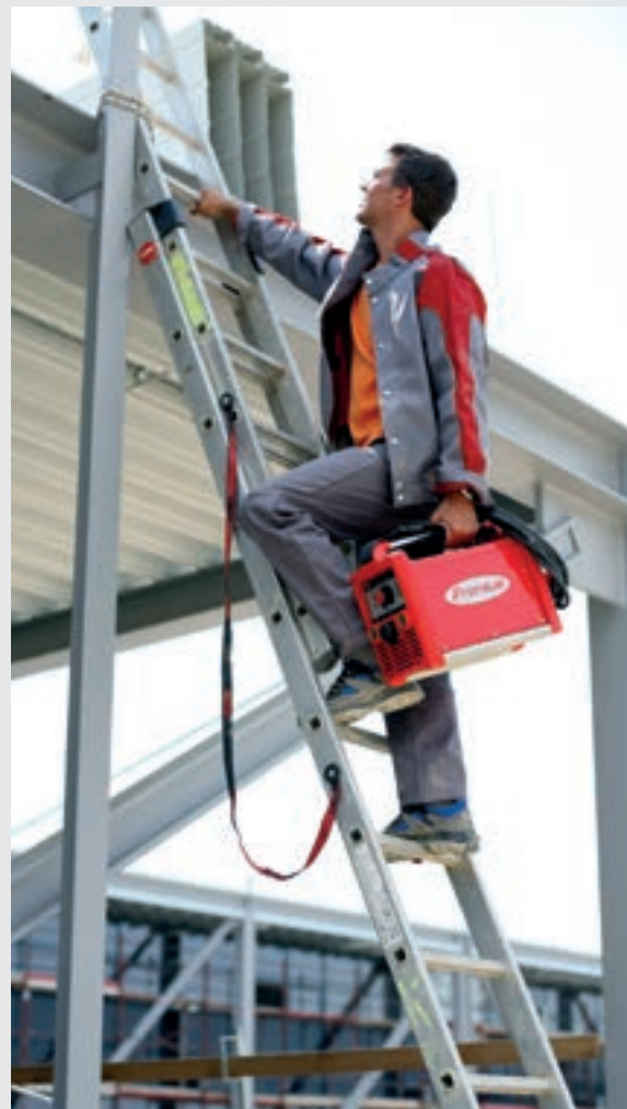
/ Lehký a mobilní, a tedy použitelný na každé stavbě.